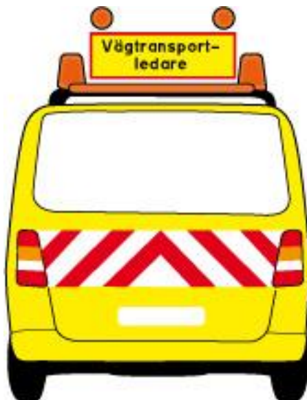
Figur 2. Röda reflekterande och vita fält baktill