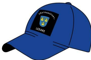
Figur 3. Mössa med skärm.

Byxorna ska vara mörkblå med hellånga ben. Byxorna ska uppfylla kraven i EN 471:2004 klass 1.