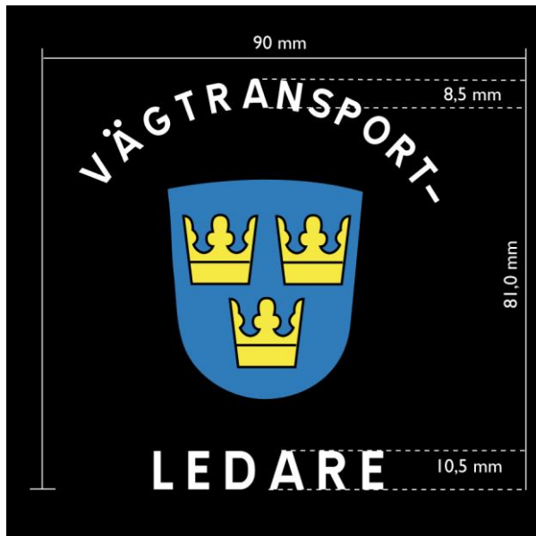
Figur 4. Ärmemblem

Emblemet ska ha svart botten och bestå av en blå sköld försedd med lilla riksvapnet och texten VÄGTRANSPORT- ovanför skölden samt texten LEDARE nedanför skölden. Sköldens höjd ska vara ca 5 cm och vara placerad centrerad mellan texterna. Emblemet ska finnas på båda ärmarna på jackan med emblemets övre kant cirka 10 centimeter från ärmsömmen vid axelspetsen. Ärmemblemet ska vara utfört i guld, blått, vitt och svart. Utseende och ytterligare mått framgår av figur 5 ovan.