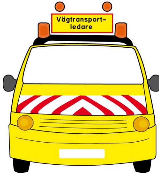
Figur 1. Röda fluorescerande och vita reflekterande fält framtill