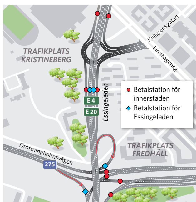
Kartan visar betalstationerna på och vid Essingeleden.

Betalstationerna på Essingeleden kommer att finnas vid trafikplats Kristineberg samt på av- och påfarterna mot Tranebergsbron i trafikplats Fredhäll.