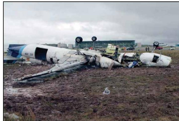
AAIU Report No. 2014_001