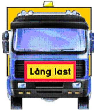
Figur 4 Varningsskyltar framåt och bakåt (p 23)